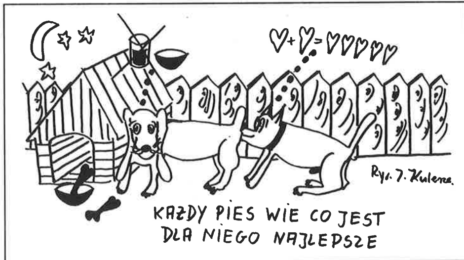
Rys. J. Kulesza