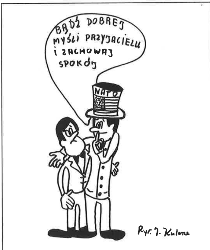
Rys. J. Kulesza