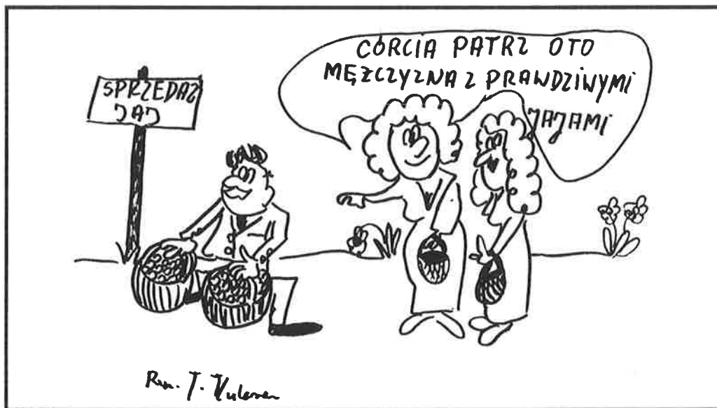
Rys. J. Kulesza

Tu skubnie, tam wyszarpienie i dla potrzebujących zawsze uzbiera. Jak ktoś nie może znaleźć roboty, to niech mu płacą i całe życie. Co mnie obchodzi jakaś giełda? Władek na to, że takich chętnych, co się ich żadna robota nie ima, jest na pęczki. Zna też takich, co i kuroniówkę biorą i w Belgii na robotach siedzą, albo takich, co mają własny biznes i zatrudniają ludzi, a dzieciaka po skończeniu szkoły po kuroniówkę, a raczej już millerówkę, wysyłają. Że są i tacy, co tylko po to idą do roboty, żeby po pół roku ją rzucić i "apiać" brać przez rok zasiłek. Ja mu na to, że co ludziom żalować, jak się należy. Rząd wie, co robi i niech ten minister z rudą brodą się nie miesza. Zabrać tym bogatym, przysolić im takie podatki, żeby wszystkim starczyło. Zdążył jeszcze Władek na odchodnym powiedzieć, że to rozdawanie pieniędzy tak działa na ludzi, że jedna kobita złożyła do urzędu w Zambrowie podanie, żeby jej dali bezzwrotną zapomogę 200 milionów, bo nie ma za co kupić glazury i boazerii do wykończenia budowanego domu. Dlaczego nie? Chodzi ostatnio po mieście taki łebski gość i namawia ludzi, żeby pisali do urzędu o pieniądze. Rozmawiał ja z nim i on mnie powiedział krótko i "wenzłowato": pisz, to dostaniesz. Żeby jeszcze ten Miller lepiej się starał, to będzie super. A Władek to ciemniak.