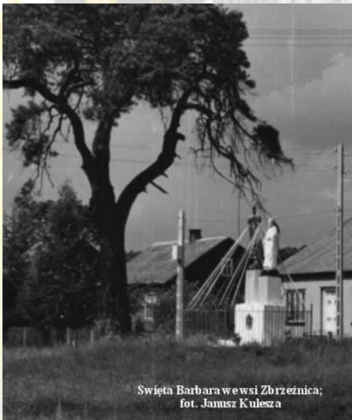
Święta Barbara w wsi Zbrzeźnica; fot. Janusz Kulesza

„Ciekawostką dla czytelnika będzie pewnie rozłożysta, karłowata sosna, która towarzyszy figurce niemal od zarania. Jest ona niemym świadkiem wydarzeń, jakie się tu rozegrały 7 lipca 1863 roku. Niezorientowanym przypominę, że doszło wtedy do potyczki między oddziałami naszych powstańców, a zorganizowanym wojskiem rosyjskim. Wracając jednak do św. Barbary - to druga wojna światowa obeszła się z nią okrutnie. Po 17 września 1939 roku, kiedy to armia sowiecka wkroczyła na nasze tereny, jej żołnierze zerżnęli na opał drewniany krzyż, który był przy niej. Sama figurka świętej stała się celem ćwiczebnego strzelania. Odstrzelono jej głowę, zaś całość pokieroszowano kulami” - cytat pochodzi ze zbioru opowiadań „Zapach mojego domu” autorstwa Janusza Kuleszy